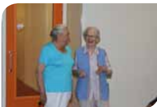
Bewoonsters van 'De Parelvissters'

De voordelen van de samenwerking zijn evident voor beide partijen die de woningen bovendien kunnen 'omlabelen' (van zelfstandige huurwoning naar AWBZ-verblijf voor een ZZP-geïndiceerde), mocht de tijd komen dat de bewoner zorg in het kader van de AWBZ nodig heeft. Verhuizen hoeft dan niet.