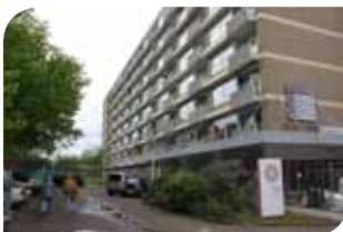
Zorg- en wijkvoorzieningen in de plint van 'De Parelvissters'