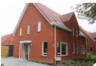
Nieuwbouw van woningstichting in Sint Annaparochie