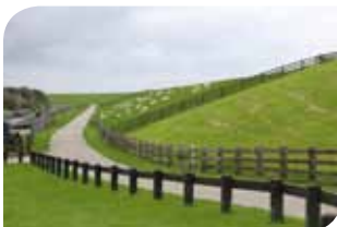
De Waddenzeedijk ten noorden van Sint Annaparochie

Om de interesse in elkaar in stand te houden is het raadzaam om de samenwerking te zoeken tussen vergelijkbare corporaties zodat de onderwerpen blijven boeien. 'Maak de club niet te groot, zo is er voldoende tijd en aandacht voor jouw onderwerpen.'