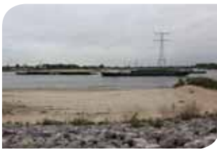
De Waal bij Druten