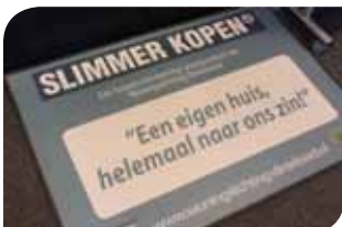
'Afstemming over woningverkoop met korting'

En wie wint heeft vrienden: vanuit Zevenbergen en Oudenbosch nemen de corporaties voortaan ook deel.