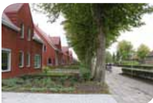
Nieuwbouw van woningstichting in Sint Annaparochie