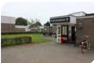
Op de rol voor 2013: een nieuwe, brede school met diverse wijkfuncties in Druten-Zuid