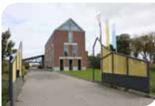
Wonen Noordwest Friesland