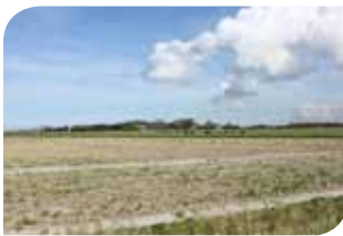
Het wijde Zeeuwse land

De samenwerkende corporaties 'plukten eerst het laaghangende fruit' en boekten daarmee snel resultaat. De volgende stap vraagt meer inzet van de deelnemers omdat de horizon nu verder weg ligt. Maar de interesse in en behoefte aan samenwerking is er: corporatie nummer zes Zeeuwsland is onlangs aangeschoven.