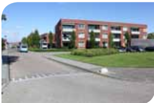
Seniorenflat met ruime binnentuin (niet zichtbaar) van Woningstichting Dinteloord

Nu heeft de samenwerking geen naam, maar levert zij wel veel op. Een greep uit de zestien successen: een gezamenlijke visie op de verwachte bevolkingskrimp, een gezamenlijke woonruimteverdeling via onder andere een internetsite, een regionale woonbeurs en afstemming over woningverkoop met korting.