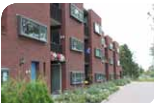
Woningbouw aan achterzijde Kulturhus in Afferden