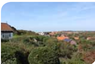
Blik op Zoutelande