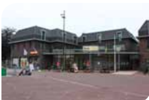
Het Kulturhus biedt onderdak aan 39 Afferdense dorpsverenigingen